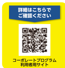
コーポレートプログラム 利用者用サイト