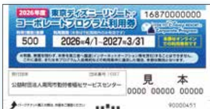
コーポレートプログラム利用券

東京ディズニーランド®/東京ディズニーシー®の パークチケットの購入時にご利用いただける利用券です。