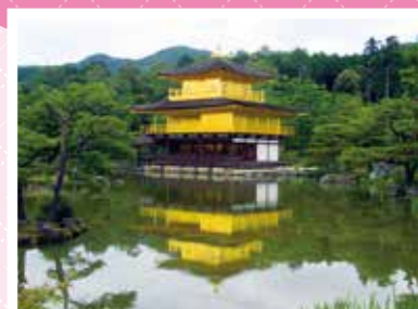
金閣寺(北区 金閣寺町)

ご注意 バス旅行は、会員及び同居のご家族に限りお申し込みいただけます。それ以外の方はご参加いただけませんので、予めご了承ください。