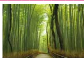
竹林の小径(右京区 嵯峨)

日にち 令和8年6月20日(土) 出発 午前5時30分 募集人員 46名(最少催行人員38名) 旅行代金 会員 9,800円 同居の家族 11,300円 料金に含まれるもの：バス代、保険料(食事は付きません) ●スケジュール 高岡市役所前 — 京都駅八条口付近乗降 — 高岡市役所前 5:30 10:30 18:30 23:30頃 旅行には添乗員が同行します。バスガイドは同行しません。 旅行企画・実施 日本海ツーリスト(株)