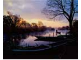
船着き場の朝

会期 令和8年4月4日(土)～6月21日(日) [月曜日は休館。ただし、祝日の場合はその翌平日] 会場 ミュゼふくおかカメラ館 幹旋枚数 会員1人につき4枚まで 会員価格 一般 600円(当日1,000円) 販売期間 令和8年4月1日(水)～6月20日(土)