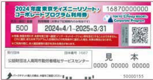
コーポレートプログラム利用券

東京ディズニーランド®/東京ディズニーシー®のパークチケットの購入時にご利用いただける利用券です。