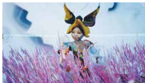
Keiken[Morphogenic Angels and The Bubble Theory]2022 © Keiken

会期 令和5年10月7日(土)~令和6年3月17日(日) 応募期間 令和5年10月14日(土)まで ※応募は会員1人1通とさせていただきます。 応募方法 応募期間内に同封の「申込書」に必要事項をご記入のうえ、FAXまたは郵送でお申し込みください。ご応募いただいた方の中から抽選で「無料招待券(ペア)」を100名様にプレゼントします。なお、当選者の発表は、発送をもってかえさせていただきます。 [抽選日:10月16日(月)・発送日:10月20日(金)]