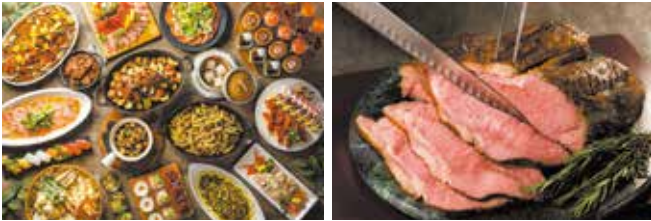
写真はディナービュッフェのイメージです

チケットご利用の際は、利用日の前日18時までにご予約ください(お食事会場が満席の場合や、特別企画開催の場合はご用意いたしかねますので、ご了承ください。) お日にちによっては二部制(18:00~19:30 と 19:30~21:00)となります。 入浴をご希望の場合は、プラス500円(通常1,000円)でご利用いただけます。 このチケットには有効期限があります。上記期間内にご利用ください。